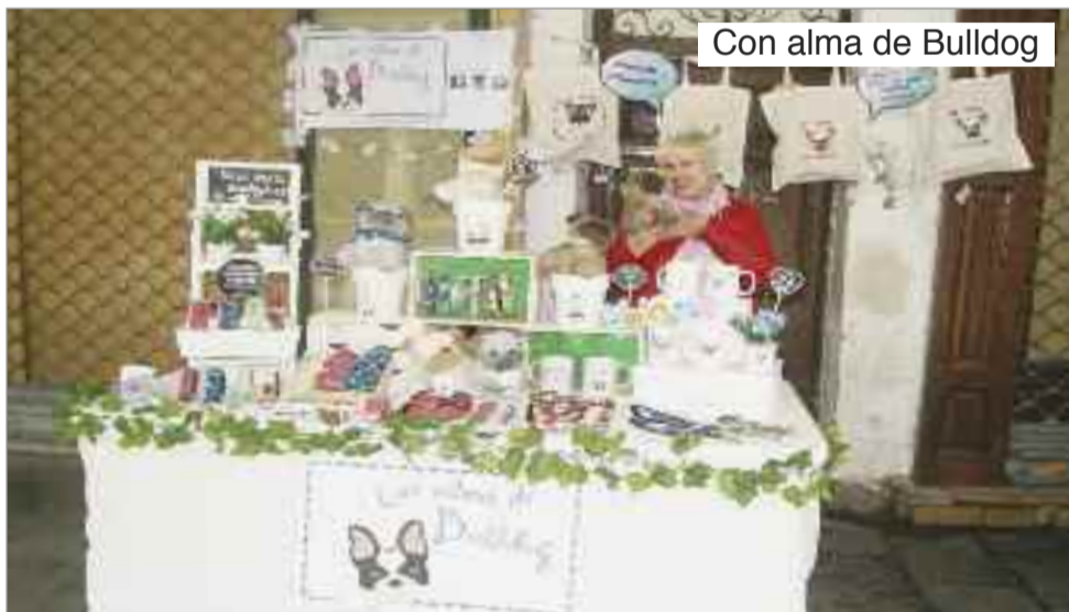
Con alma de Bulldog