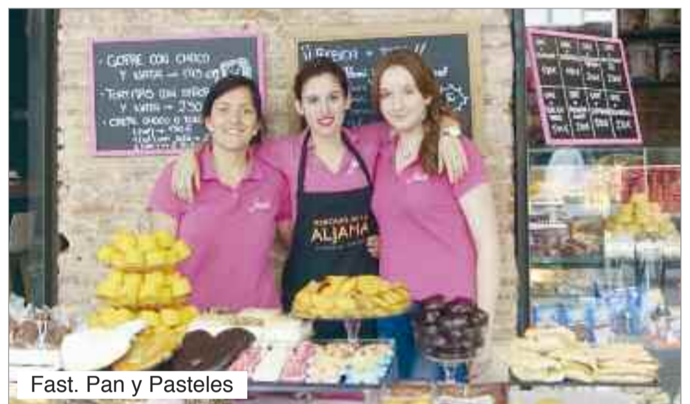
Fast. Pan y Pasteles

La concejalía de Comercio del Ayuntamiento de Alcalá de Henares prevé nuevas ediciones de este Mercado los meses los meses de junio y julio.