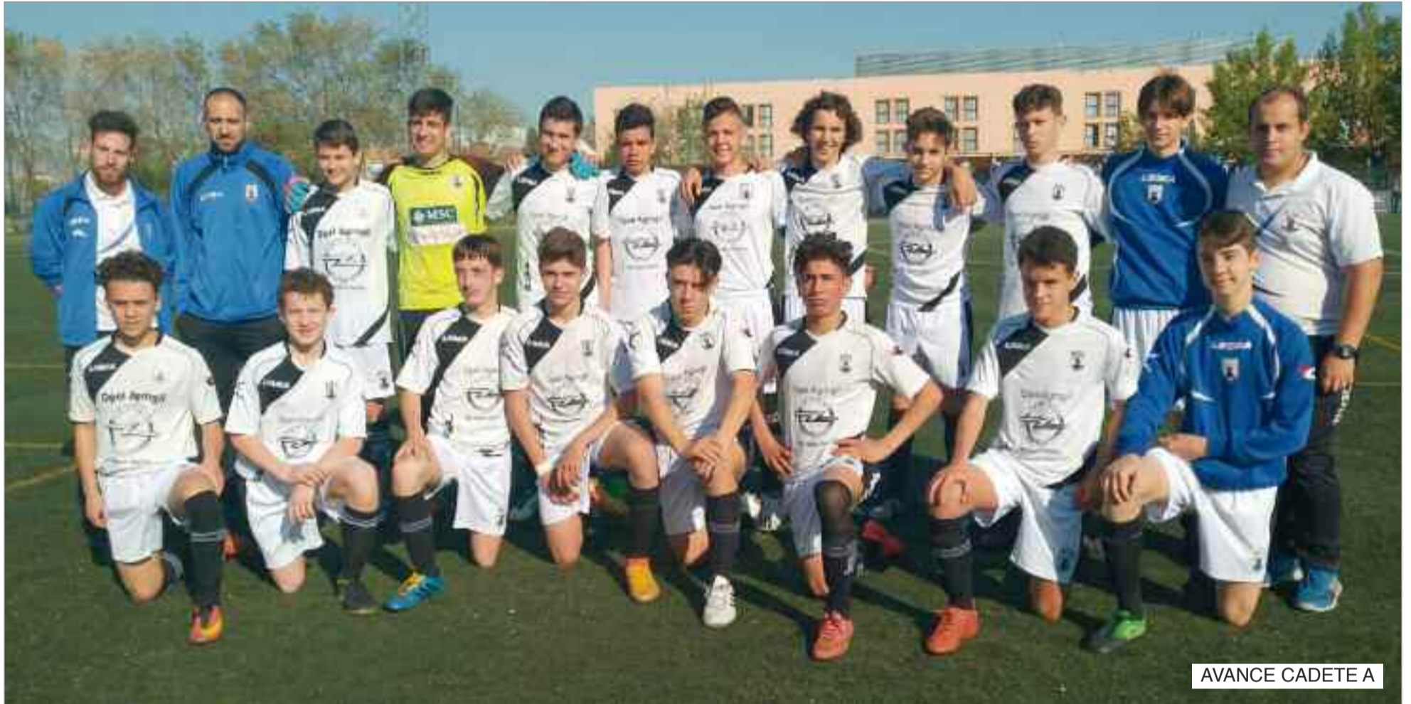
AVANCE CADETE A

Dividido en tres categorías, el “PIPE” alcanzó su edición número 31. El “Pipe Chico” sirvió para promocionar las categorías más pequeñas como las de alevín, benjamín y muy especialmente la de prebenjamines a quienes es siempre un gustazo ver en el campo. Éxito rotundo también del “Pipe Femenas” y en el que el senior del Avance quedó subcampeón y las alevines del C.D. Avance A quedaron terceras en un grupo muy exigente en el que el campeón fue el Madrid C.F.F