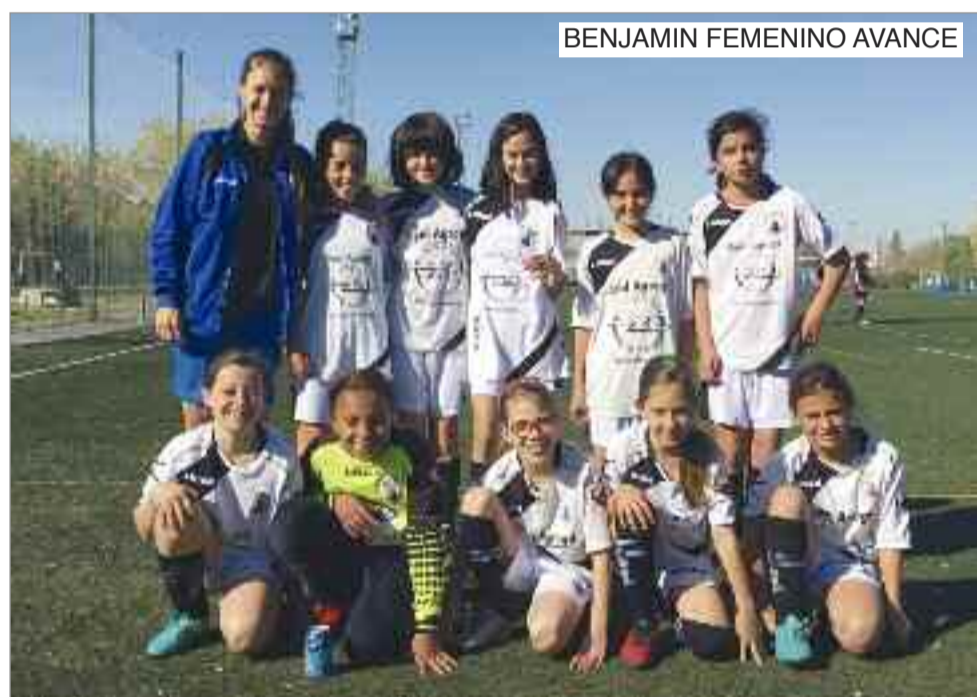
BENJAMIN FEMENINO AVANCE