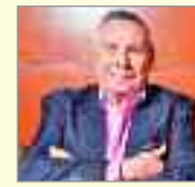
Luis de Blas Poeta / Escritor