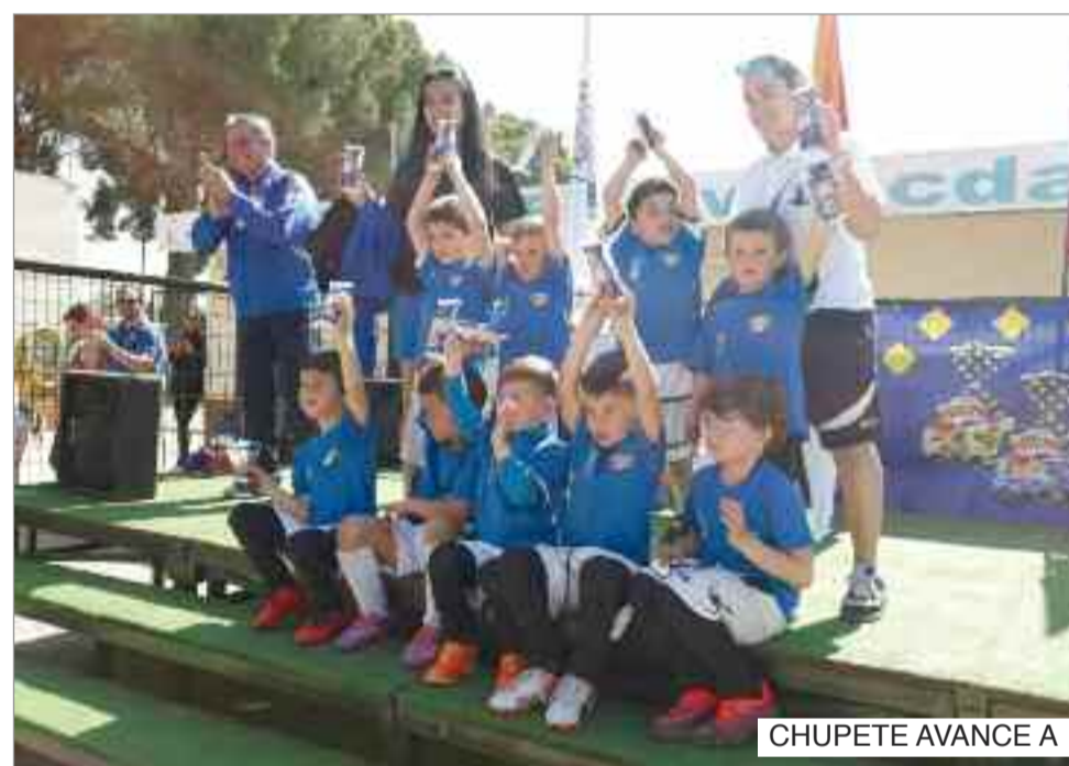
CHUPETE AVANCE A