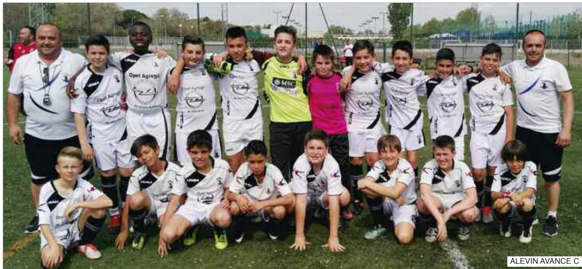
ALEVIN AVANCE C