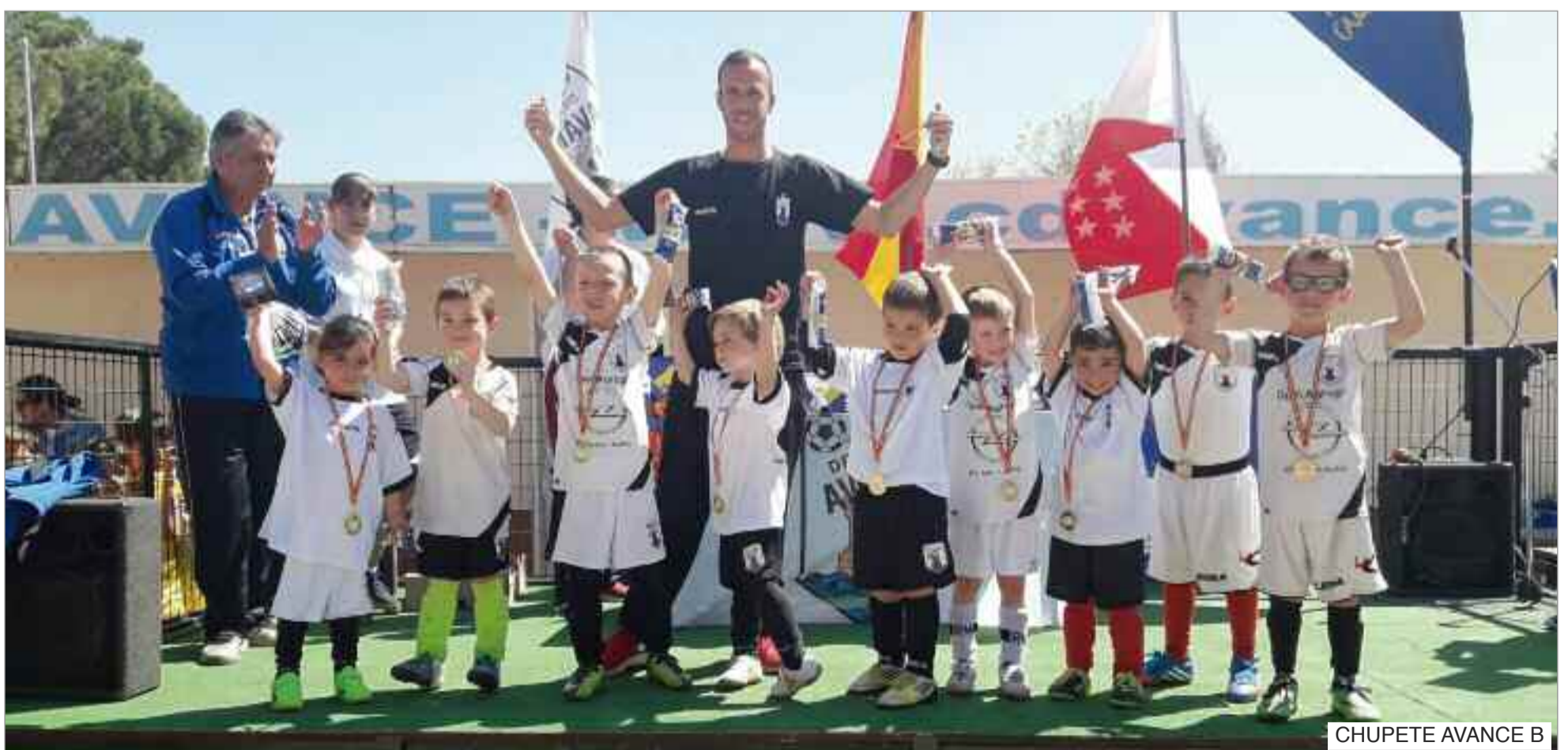
CHUPETE AVANCE B